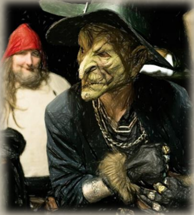
Ein gieriger Goblin namens „Jimmy“ ist der neue „Schatzmeister“ von Bhemoth Blutmond. Gibt es da noch mehr zu sagen?