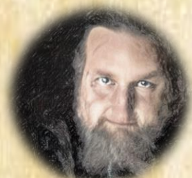
HEINRICH ZU FELSENERZ VON 1640 BIS 1722 IM DIENSTE GROVOD

BELOHNUNG 10 GOLDSTÜCKE (TOT ODER LEBENDIG)