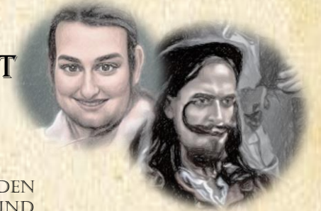
ARMIN KASTRO UND PATER JANOSCH ERSTELTEN NEZKANNO KATAKOMBEN UNTER LUNACROVI

DA DER SCHLÜSSEL ZU DEN KATAKOMBEN UNTER LUNACROVI IM EIFER DES GEFECHTES GEGEN DEN DÄMON ARMIN KASTRO ABHANDENGEKOMMEN SEI. DIE BÜRGER PRIZRAKIS BEGINNEN LANGSAM DIE UNANTASTBARKEIT DER SANKT KERIANISCHEN KIRCHE GEGENÜBER DEM NEZKANNO AN ZU ZWEIFELN DA MIT DEM PSYCHISCHEN ANGRIFF SEITENS KASTRO AUF DEN JÜNGST ENTSANDTEN SIR DAVID AUCH EIN WEITERER SANKT KERIANER, WENN AUCH NUR KURZZEITIG, DEM NEZKANNO VERFALLEN SEIN SOLL. ZUM GLÜCK ABER LIEß SICH DIES NOCH RECHTZEITIG ABWENDEN. DENNOCH BEFÜRCHTEN DIE BÜRGER PRIZRAKIS NUN, WER NOCH ALLES IN DER SANKT KERIANISCHEN KIRCHE INFIZIERT SEIN KÖNNTE UND OB SIE WIRKLICH DAZU IN DER LAGE SIND UNS ALLE VOR DEM NEZKANNO ZU SCHÜTZEN. DOCH IN DER DERZEITIGEN LAGE WO WIR NUN GLEICH DREI ANWÄRTERINNEN AUF DEN THRON DER STARAYA HABEN UND DAS VOLK SELBST UNEINS SCHEINT WIRD ES SCHWER DAS WIR UNABHÄNGIG SEIN KÖNNEN VON DER KIRCHE. DER PAPST SANKT KERIAN'S VERSPRICHT JEDOCH BALDIGE LÖSUNGEN UND VERSICHERT UNS DASS WIR BALD WIEDER AUF EIGENEN BEINEN STEHEN KÖNNTEN.