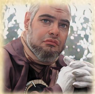
ORDENSBRUDER DER TEMPELRITTER BRUDER GIDEON

AUFGRUND DER AUSSAGE DES TEMPELRITTER ORDENSBRUDERS GIDEON SOLL WOHL DURCH DEN DAMALIGEN SANKT KERIANISCHEN PATER JANOSCH GOTTHELF WIE AUCH SEINEM HERREN UND MEISTER ARMIN KASTRO (EBENFALLS SANKT KERIANER) EIN TUNNEL SYSTEM UNTER LUNACROVI (DAMALS NOCH DAS DORF BLAGOCHESTIVAYA) ERRICHTET WORDEN SEIN. DIESES WURDE AUFGEDECKT DURCH UNSER ALLER ERLÖSERIN LUCIJANA DANJA. MAN MUTMAßT DAS SICH DORT EIN PORTAL ODER ÄHNLICHES BEFINDEN SOLL WELCHES BEIDE ERSCHAFFEN HATTEN JEDOCH NICHT VOLLENDEN KONNTEN. LEIDER IST ES WOHL DERZEIT UNMÖGLICH DORTHIN ZU GELANGEN