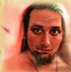
BHEMOTH BLUTMOND ATAMAN VON LUNACROVI, BRAUMEISTER UND TECHNIKER