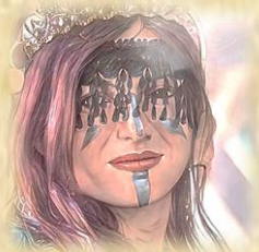
STOYKA LUCIANA DANJA, HOFFNUNG VON PRIZRAKI, WURDE EBENFALLS IHRES ELEMENTARES BERAUBT

AUFGRUND DIESER VORKOMMNISSIE ORDNET DER PAPST VON SANKT KERIAN PERSÖNLICH AN, DAS VON NUN AN DIE STOYKA UNTER DEM SCHUTZE DER KIRCHE VON SANKT KERIAN STEHEN UND SICH EINE JEDE STOYKA DEN SEGEN VON IHM PERSÖNLICH EMPFANGEN WIRD. HIERFÜR REIST DER PAPST PERSÖNLICH AN UND WIRD AN JEDER STOYKA EINZELN, UNTER DER AUFSICHT DER EHEMALS GEÄCHTETEN BABA YAGAR WIE AUCH STOYKA DANJA UND STOYKA MORVA EINEN SEGEN DER KERIANISCHEN KIRCHE SPRECHEN AUF DAS DAS ELEMENTAR IN EINER JEDEN STOYKA GESCHÜTZT UND GESTÄRKT SEI IM KAMPFE GEGEN DAS NEZKANNO. UND NIE WIEDER EINE STOYKA IM KAMPFE GEGEN DAS NEZKANNO SEIN ELEMENTAR VERLIEREN WIRD.