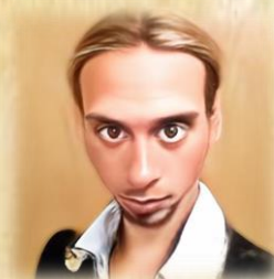
TURAMBA BLUTMOND RUHNENSCHMIED UND ATAMANEN BERATER VON LUNACROVI